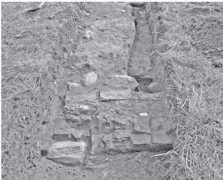
Fra udgravningerne i Gurre 2000/2001 - Felt R 055.

demars Jagt" fra 1816. Digtet nævner ikke Tove, men skildrer Valdemar som en mand, hvis glæde ved det jordiske bringer ham i konflikt med kirken.